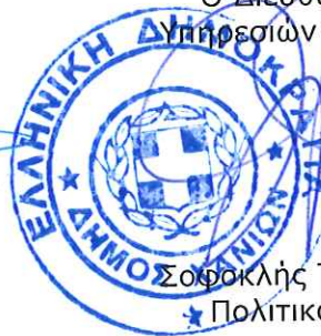
Σοφοκλής Τσιραντωνάκης Πολιτικός Μηχανικός