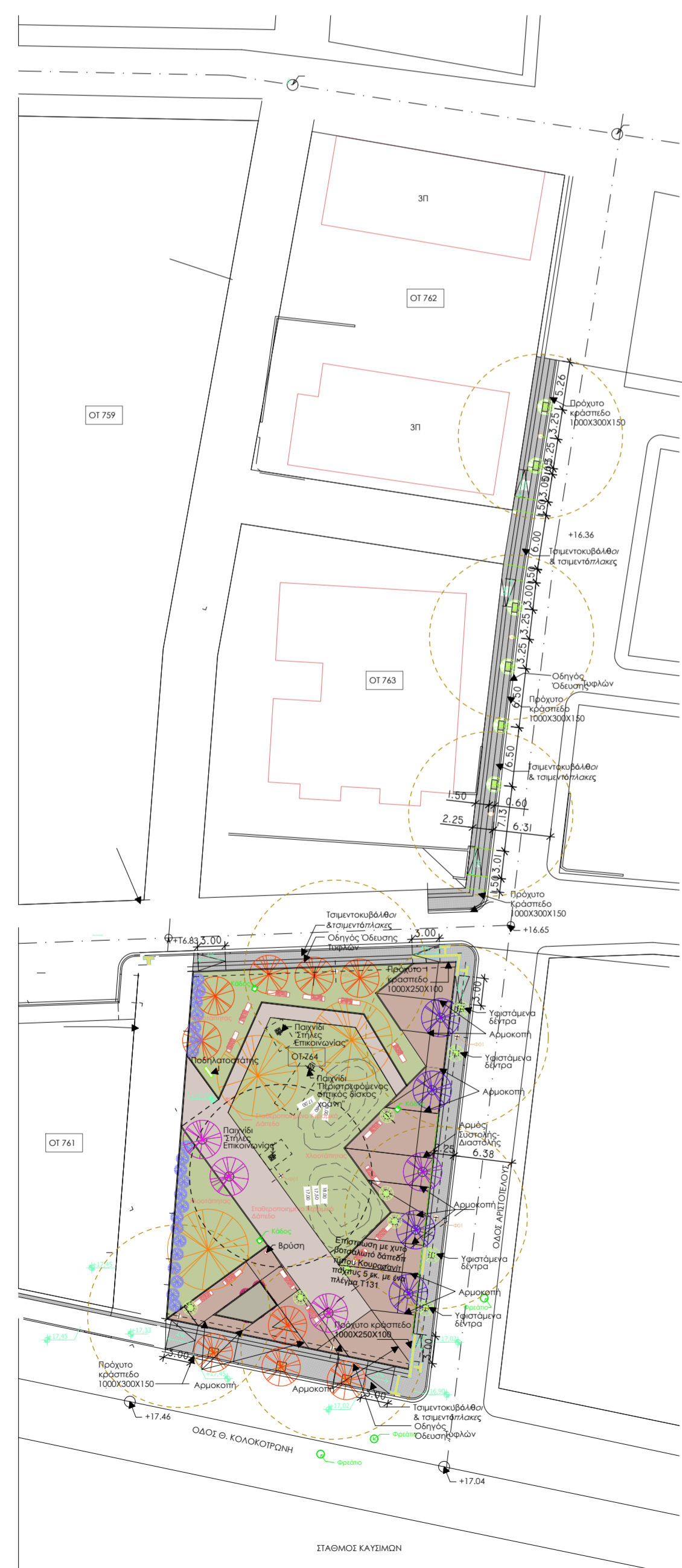
ΣΧ. ΠΟΛΗΣ ΚΟΥΜΠΕ ΜΟΥΡΝΙΩΝ Ο.Τ. 764 & ΠΕΖΟΔΡΟΜΙΟ