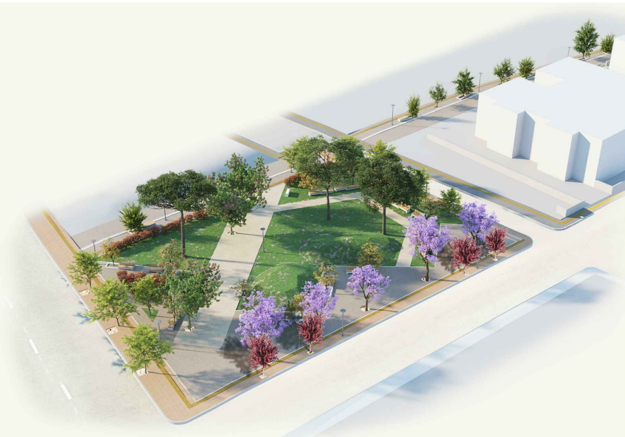
ΣΥΝΟΛΙΚΗ ΑΠΕΙΚΟΝΙΣΗ ΔΙΑΜΟΡΦΩΣΗΣ ΠΑΡΚΟΥ ΚΑΙ ΠΕΖΟΔΡΟΜΟΥ ΑΠΟ ΨΗΛΑ