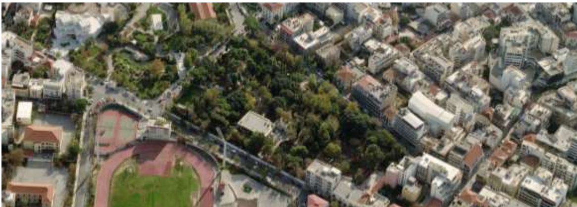
Bird's eye view οδός Α. Παπανδρέου