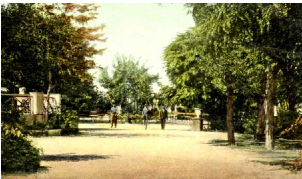
Souvenir de Crète. Δημοτικός Κήπος επί τῶ Χανιά. Jardin Publique a la Canée.