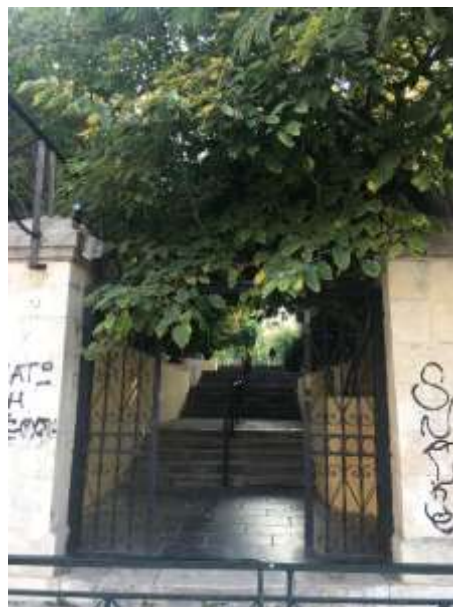
είσοδος από οδό Α.Παπανδρέου