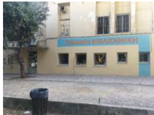
παιδική δημοτική βιβλιοθήκη