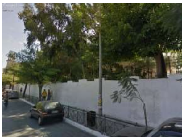
ψηλό όριο από οδό Α.Παπανδρέου