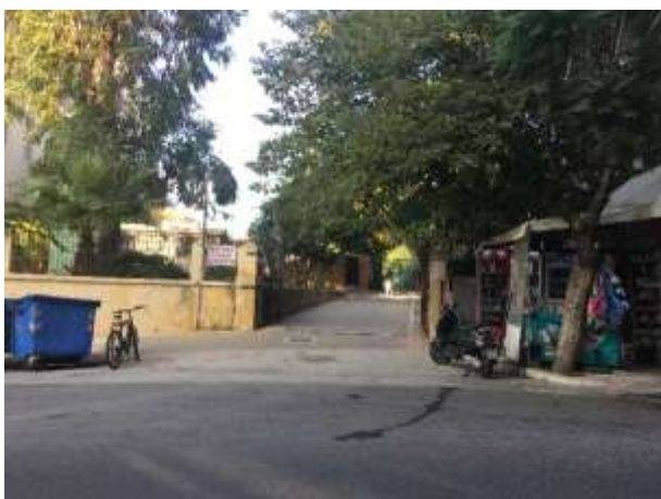
δύο εισοδοι από οδό Στρ.Τζανακάκη