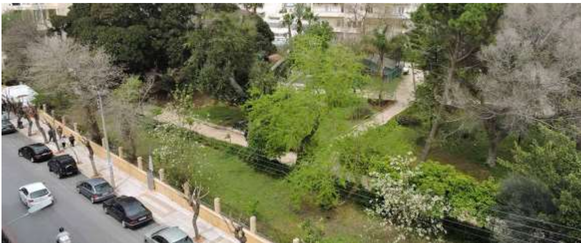
από οδό Στρ. Τζανακάκη