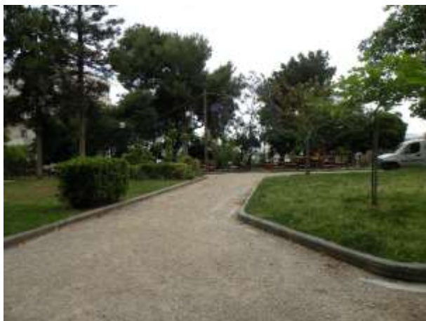
διάδρομοι με κρασπεδόρειθρα οδοποιίας

Εσωτερικά ο κήπος διαμορφώνεται με δεντροφυτεμένα παρτέρια που διαχωρίζονται από τους χωμάτινους διαδρόμους κίνησης με κρασπεδόρειθρα από σκυρόδεμα. Η γεωμετρία και οι διαστάσεις των εσωτερικών διαδρομών έχουν προκύψει από τον αρχικό σχεδιασμό του κήπου αλλά και από την ανάγκη κίνησης οχήματος για την φροντίδα και τον καθαρισμό των υφιστάμενων μεγάλων δέντρων. Κάποιες περιοχές έχουν πλακοστρώσεις με κυβόλιθο ή πλάκες καρύστου, όπως τα πλατύσκαλα των εισόδων, η περιοχή μπροστά από το καφενείο και γύρω από την αίθουσα της παιδικής βιβλιοθήκης.