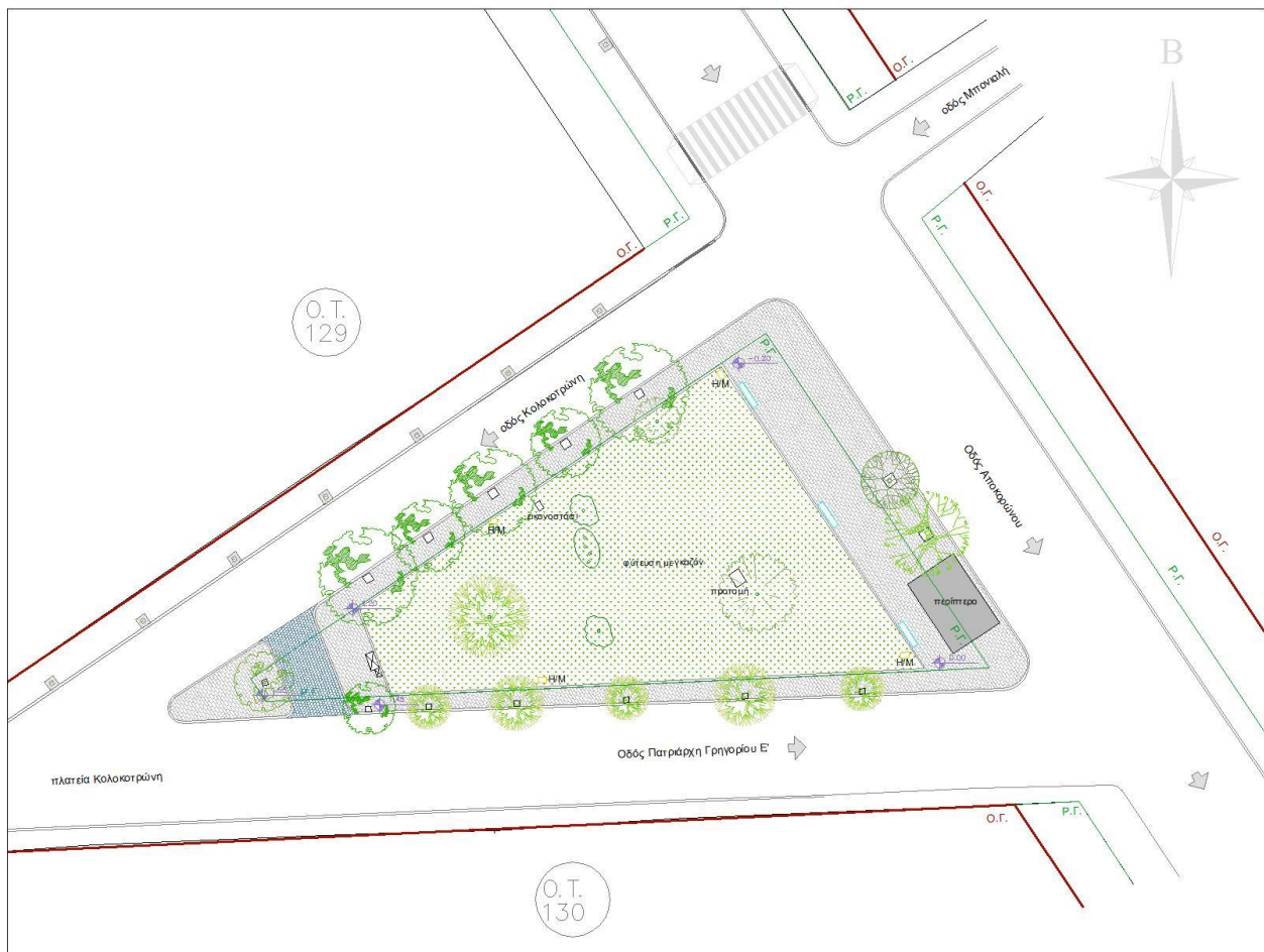
ΕΙΚ.1 Απόσπασμα κάτοψης υφιστάμενης κατάστασης

Σήμερα η πλατεία έχει εδαφοκάλυψη πρασίνου, 3 μεγάλα δέντρα, σημεία με χαμηλή βλάστηση και την προτομή του Παρθενίου Κελαιδή. Το προσβάσιμο σημείο σήμερα της πλατείας γίνεται μόνο για την προτομή, ενώ σε όλα τα άλλα σημεία υπάρχει χαμηλή μεταλλική περίφραξη πάνω σε κράσπεδο.