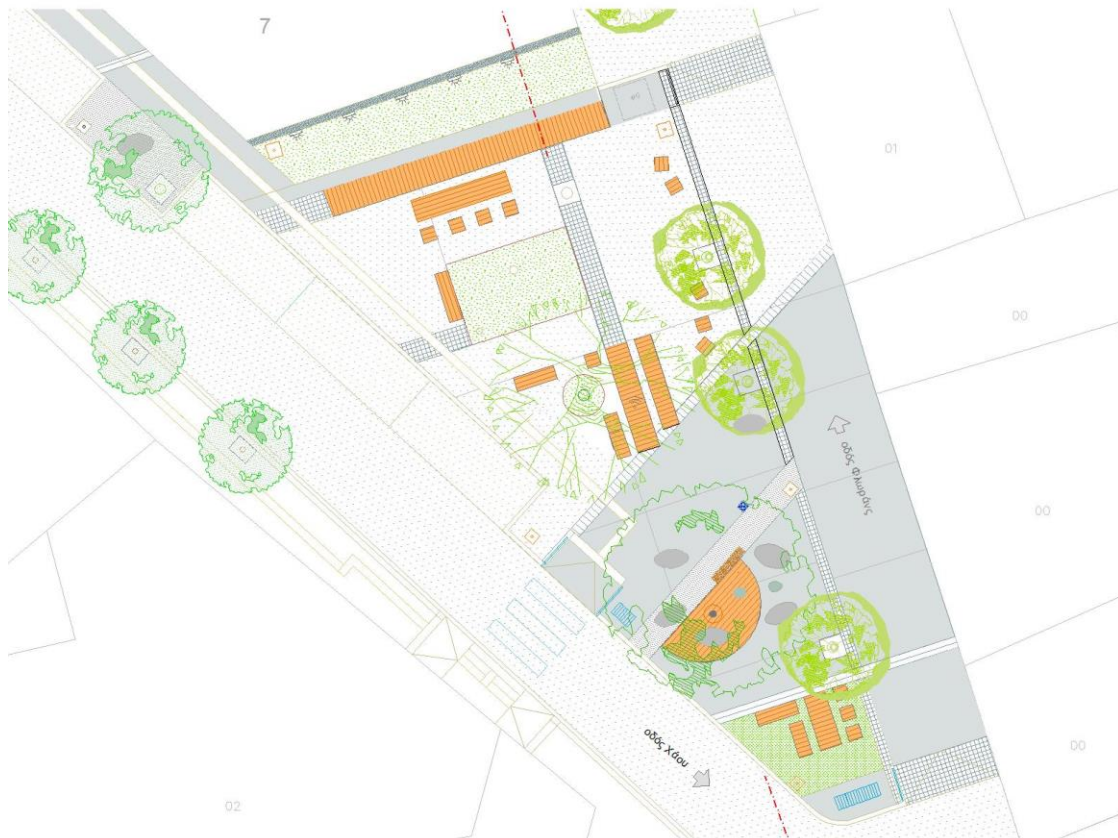
Εικ. 19 Απόσπασμα προτεινόμενης κάτοψης

Πρέπει να τονίσουμε ότι σημαντικό στοιχείο αυτής της μελέτης είναι και η αποκατάσταση της προσβασιμότητας της γειτνιάζουσας περιοχής και η διευθέτηση της άναρχης στάθμευσης έτσι ώστε να γίνεται δυνατή με ασφάλεια η κίνηση των πεζών που συνάδουν με τις προδιαγραφές και τις κατευθύνσεις που δίνει η πολιτική προστασία.