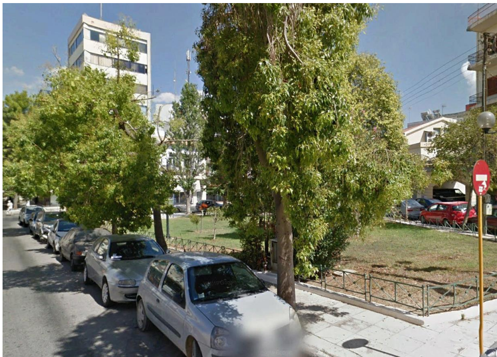
ΕΙΚ.5. Άποψη από την οδό Κολοκοτρώνη