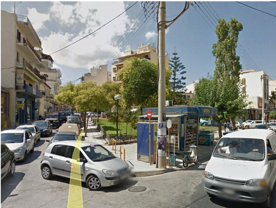
ΕΙΚ.3. Άποψη από την συμβολή των οδών Αποκορώνου και Γρηγορίου 5ου