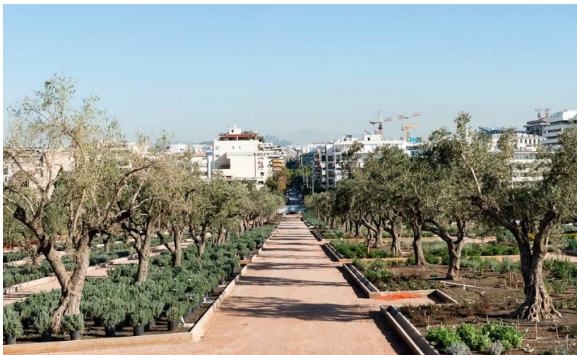
Εικ. 8 Διάδρομοι από σταθεροποιημένο χώμα

Τα παρακείμενα πεζοδρόμια διαστρώνονται με κυβόπλακες σκυροδέματος όμοια με τα υλικά των πρόσφατα δημιουργημένων πεζοδρομίων στις οδούς Αποκορώνου και Γρηγορίου 5ου.