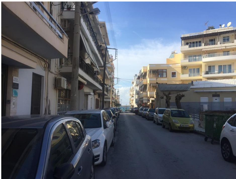
Εικ. 17 Οδός Χάου. Πολύ μικρά πεζοδρόμια 0.85μ και στάθμευση και στις 2 πλευρές. Η πρόσβαση στο πάρκο από την γειτονιά γίνεται με δυσκολία, και από ΑΜΕΑ είναι ανέφικτη.