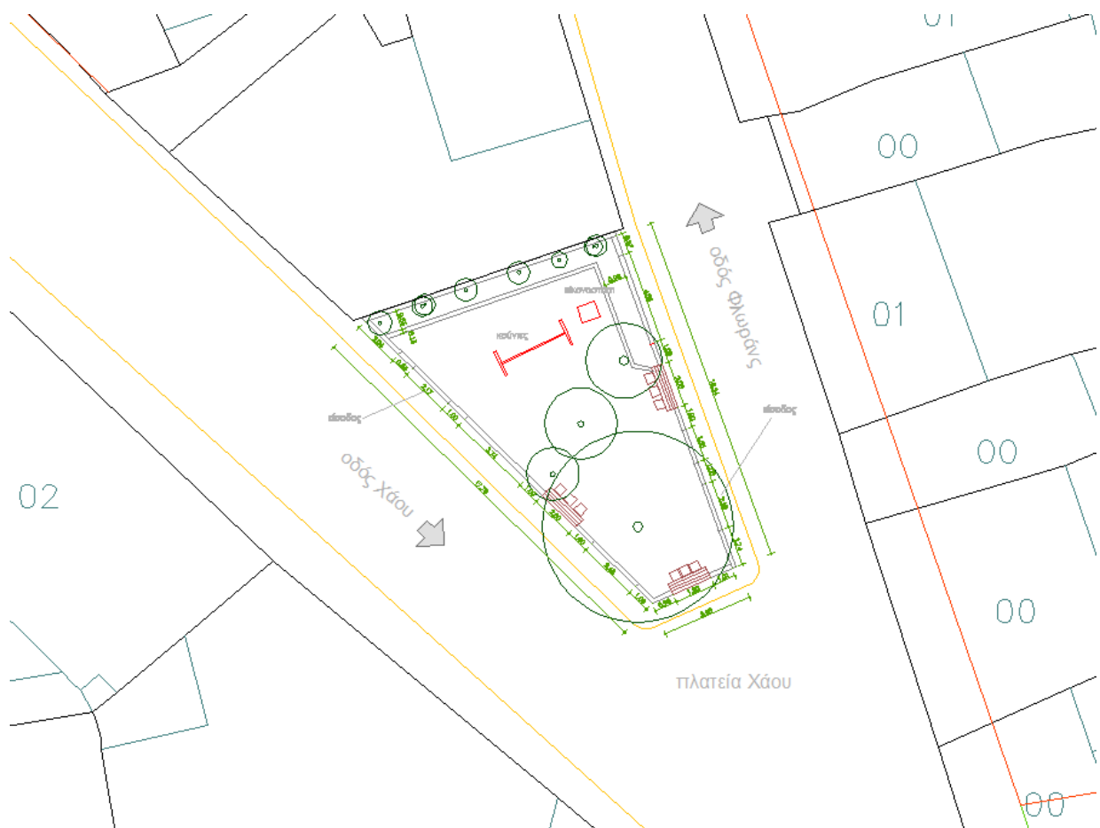
Εικ. 13 Απόσπασμα υφιστάμενης κάτοψης

Το πάρκο διαθέτει δύο εισόδους. Μια από την οδό Φλωρώνς Γουσταίου και μια από την οδό Χάου Σαμουήλ. Η περίφραξη του πάρκου έχει ύψος 0,85μ. από το πεζοδρόμιο. Το πεζοδρόμιο περιμετρικά του πάρκου είναι πλάτους 0,85μ.