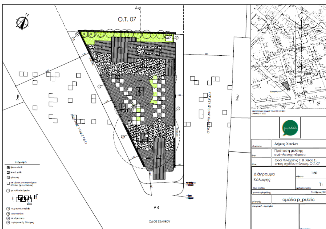
Εικ. 18 Κάτοψη πρότασης ομάδας p_public

Από το 2013, η ομάδα “p_public” σε συνεργασία με το Σύλλογο Κατοίκων Νέας Χώρας επέλεξαν από κοινού να πραγματοποιήσουν τη προαναφερόμενη δράση, σε ένα ανοιχτό και ελεύθερο χώρο πρασίνου, εντός του πολεοδομικού συγκροτήματος του Δήμου Χανίων. Συγκεκριμένα, η περιοχή επέμβασης βρίσκεται στη συμβολή των οδών Φλωράνης Γουσταίου & Χάου Σαμουήλ, επί του Ο.Τ. 07, στην συνοικία της Νέας Χώρας. Από την δράση αυτή προέκυψε η προμελέτη που φαίνεται στην κάτοψη παρακάτω.