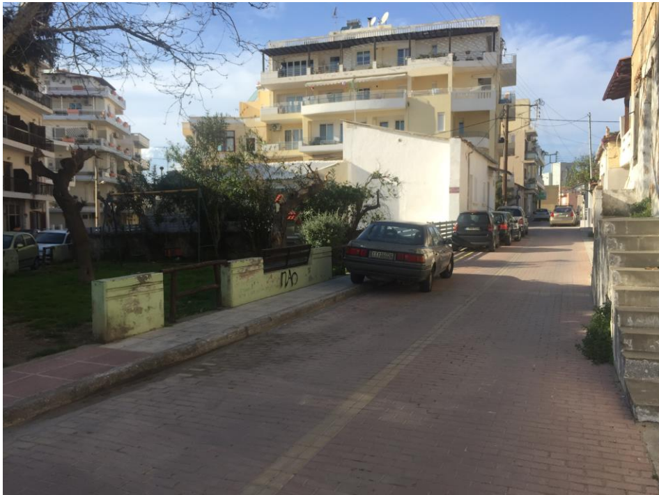
Εικ. 15 Άποψη του πάρκου(οδός Φλωρανς)