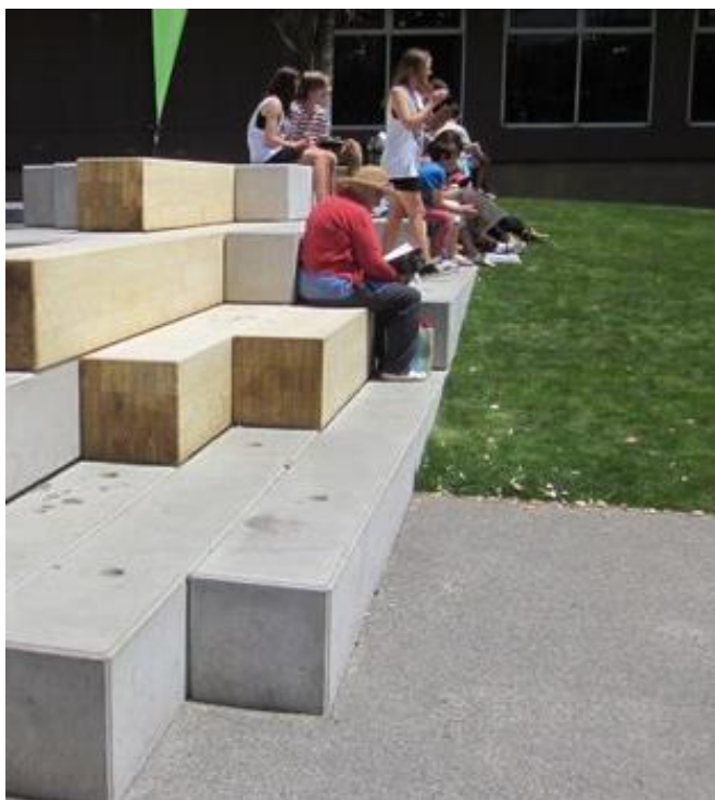
Εικ. 10 Τυπολογία διαζωμάτων καθιστικών