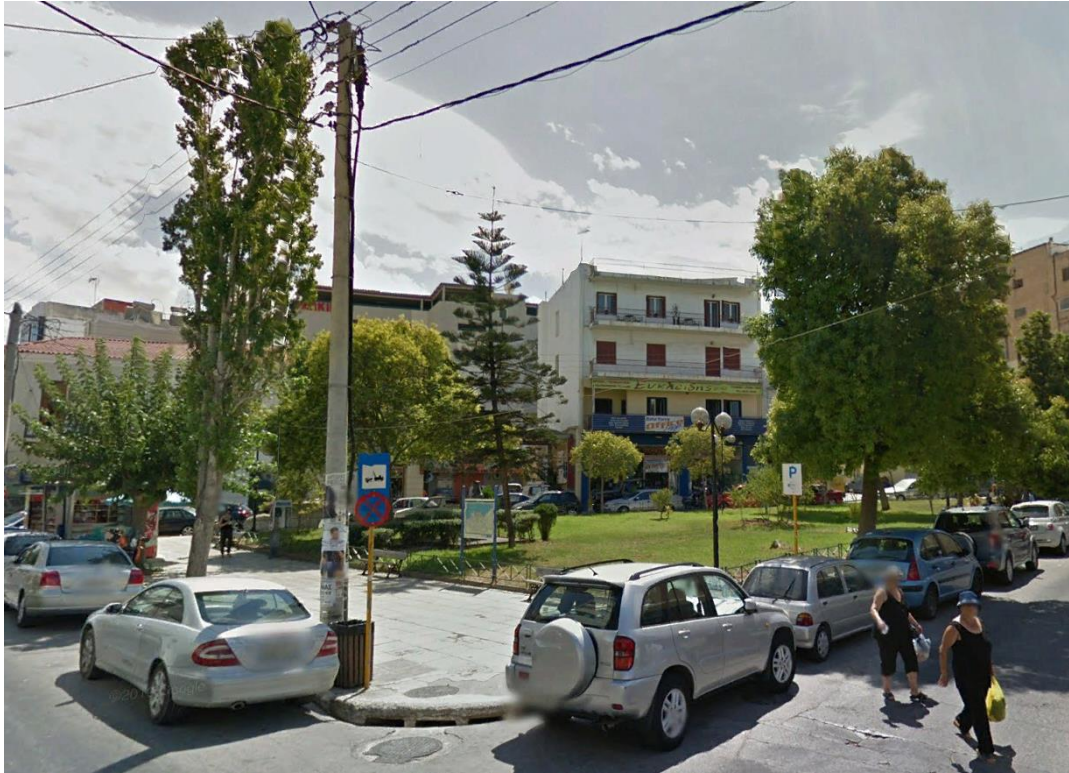
ΕΙΚ.2. Άποψη από την συμβολή των οδών Αποκορώνου και Κολοκοτρώνη