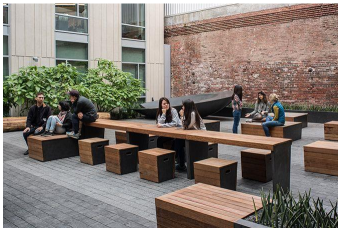
Εικ. 20. Τυπολογία Αστικού Εξοπλισμού