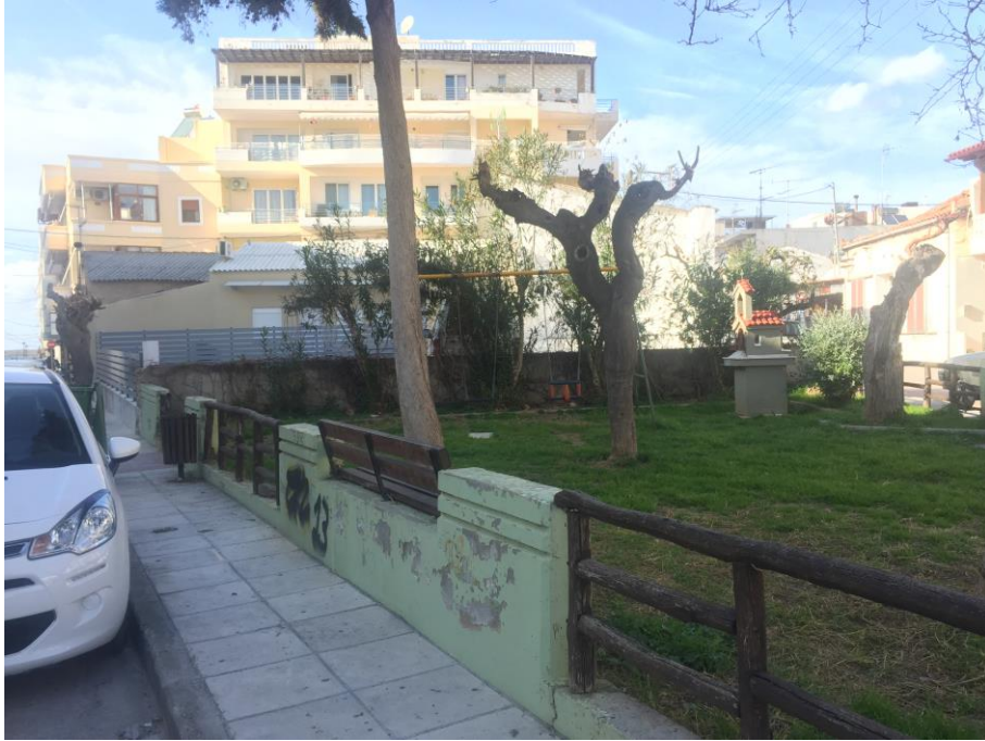
Εικ. 14 Άποψη του πάρκου(οδός Χάου)