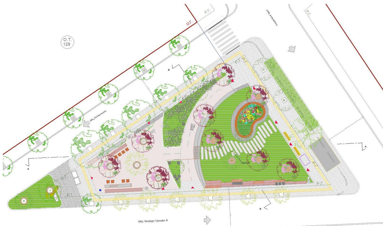
Εικ. 6 Κάτοψη πρότασης διαμόρφωσης χώρου καταφυγής CH05

Η πρόταση διαμόρφωσης στοχεύει καταρχήν στην ένταξη της παρέμβασης στον πολεοδομικό ιστό της πόλης, στην βελτίωση των υφιστάμενων περιοχών κίνησης και στη δημιουργία χώρων στάσης και αναψυχής της πλατείας καθώς και στην κατασκευή των απαραίτητων εγκαταστάσεων ώστε να μπορεί με βάση τις προδιαγραφές της Πολιτικής Προστασίας, να λειτουργήσει ως οργανωμένος και με σωστές υποδομές χώρος καταφυγής για τους κατοίκους της ευρύτερης περιοχής παρέχοντας ασφάλεια σε περίπτωση σεισμού.