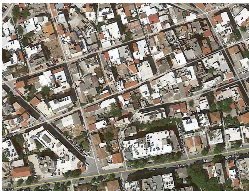
Εικ. 11 Google earth χάρτης θέσης χώρου καταφυγής CH12