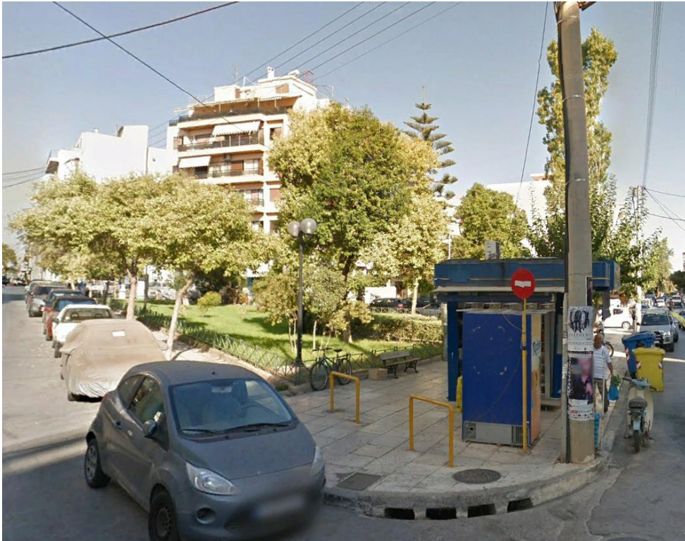
ΕΙΚ.4. Άποψη από την συμβολή των οδών Αποκορώνου και Γρηγορίου 5ου