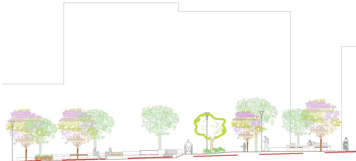
Εικ. 7 Τομή πρότασης διαμόρφωσης χώρου καταφυγής CH05 στο πλάτωμα επί της οδού Αποκορώνου

Στο πλάτωμα με συνεπίπεδη είσοδο από την συμβολή των οδών Κολοκοτρώνη και Γρηγορίου 5ου δημιουργούνται αμφίπλευρα καθιστικά διαζώματα και πάγκος και προστίθεται βρύση.