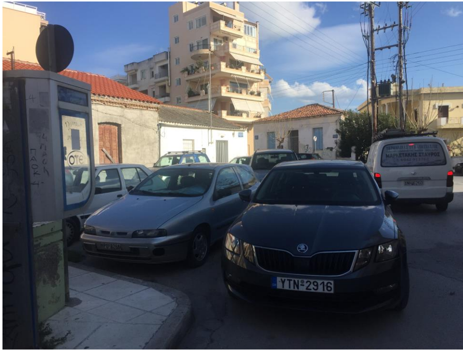
Εικ. 16 Άποψη από το πάρκο προς την οδό Σελίνου. Φαίνεται η άναρχη στάθμευση