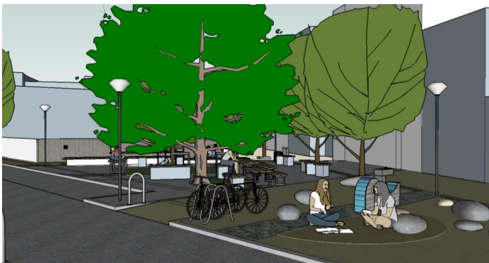
Εικ. 21. Φωτορεαλιστική άποψη από την οδό Χάου.