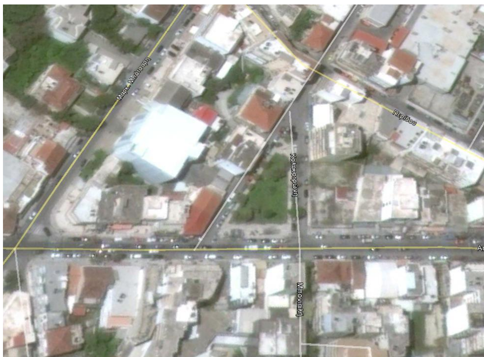
Googlearth χάρτης θέσης χώρου καταφυγής CH05