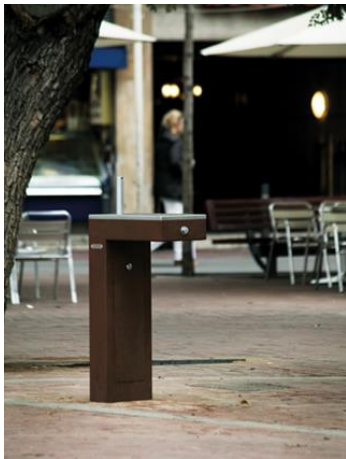
Εικ. 9 Τυπολογία βρύσης