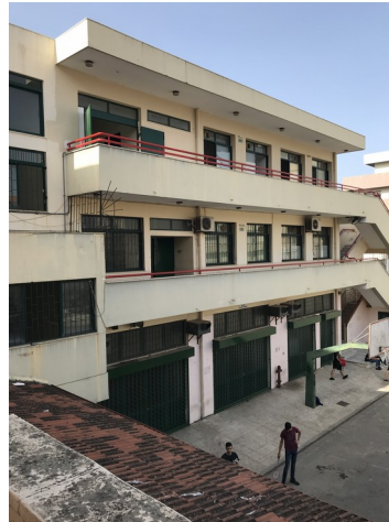
φωτ.11 : νότιο κτίριο συγκροτήματος