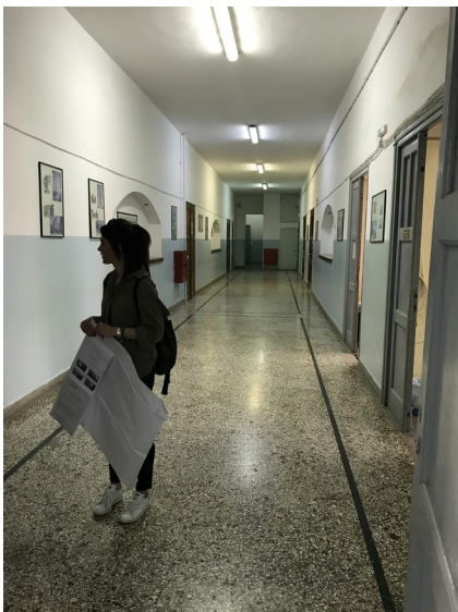
Φωτ. 12: εσωτερικά κεντρικού κτιρίου συγκροτήματος