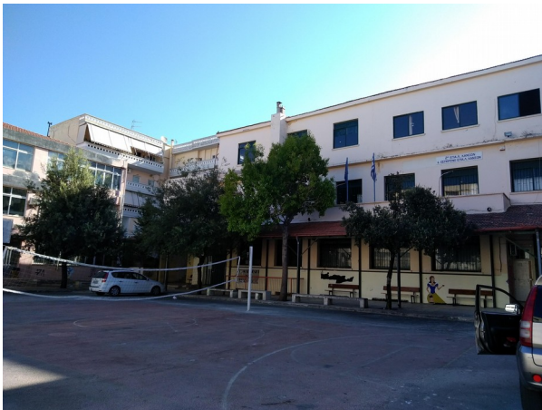
Φωτ. 10: κεντρικό κτίριο συγκροτήματος