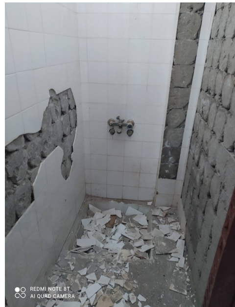
Φωτ. 3: Εγκατ.Χώρος Υγιεινής Γυμναστηρίου