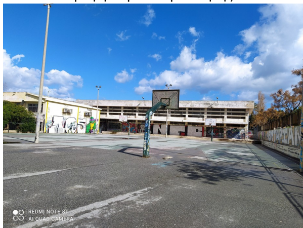
Φωτ. 7: Κτίριο Γυμναστηρίου εξωτερικά