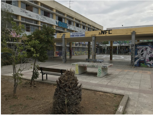
Φωτ. 9: Ημιυπαίθριοι χώροι