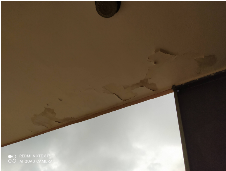
Φωτογραφία 1: Πρόβολος εξωτερικά κτιρίου Λυκείου