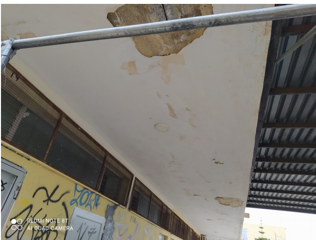
Φωτ. 4: Πρόβολος κτιρίου Γυμναστηρίου εξωτερικά