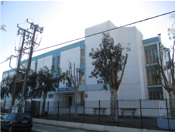
Φωτ. 13: κτήριο συγκροτήματος εξωτερικά