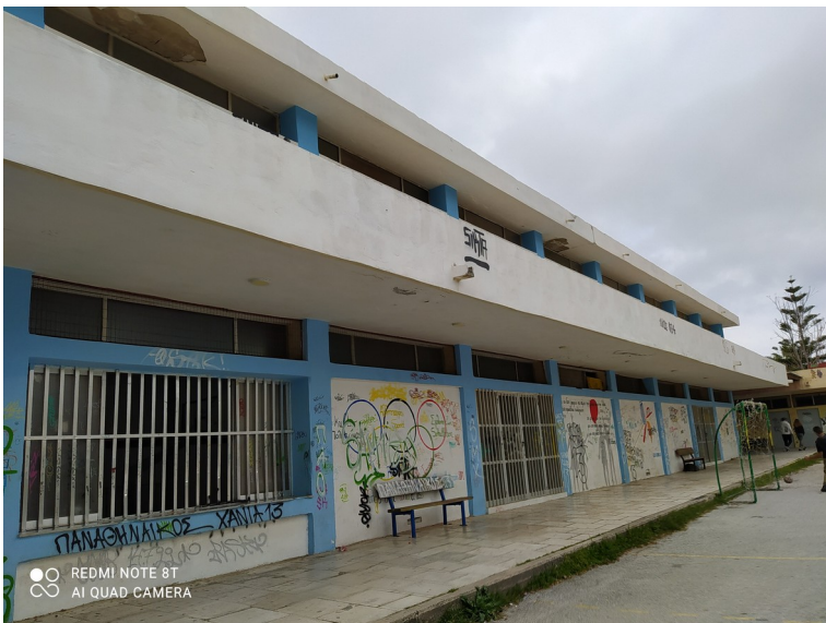
Φωτ. 2: Κτίριο Γυμναστηρίου Συγκροτ. Κουμπέ