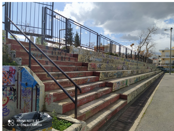
Φωτ.8 : Χώροι κερκίδων υπαίθριων γηπέδων