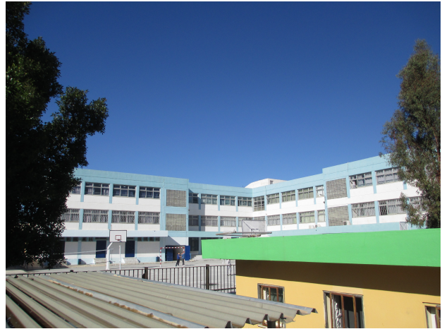
Φωτ. 14: κτήριο συγκροτήματος εξωτερικά

Λόγω της φύσης του έργου, όπως έχει περιγραφεί παραπάνω, δεν κατατάσσεται στην κατηγοριοποίηση της παραγράφου του άρθρου 1 του Ν.4014/21.09.2011 όπως αυτή έχει τροποποιηθεί σύμφωνα με την παράγραφο 3 του άρθρου 3 της Υ.Α.37674/2016 (ΦΕΚ 2471B/10-08-2016) με αποτέλεσμα να απαλλάσσεται από τη διαδικασία Περιβαλλοντικής Αδειοδότησης.