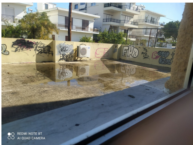
Φωτ. 5: Οροφή κτιρίου Βιβλιοθήκης