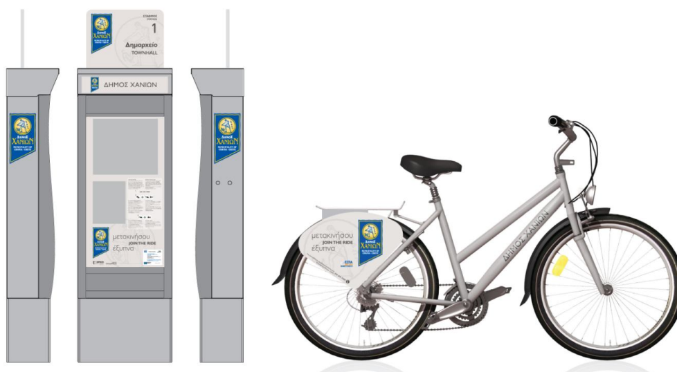
Εικόνα 1 ΣΤΑΘΜΟΣ ΑΥΤΟΜΑΤΗΣ ΔΙΑΘΕΣΗΣ ΠΟΔΗΛΑΤΩΝ ΣΤΗΝ ΠΑΛΙΑ ΠΟΛΗ ΧΑΝΙΩΝ

Ο κάθε σταθμός αυτόματης διάθεσης ποδηλάτων περιλαμβάνει τη δυνατότητα χρήσης πιστωτικής κάρτας προκειμένου για την απελευθέρωση του ποδηλάτου, καθώς και δανεισμό του ποδηλάτου με κάρτα μέλους χρήστη.