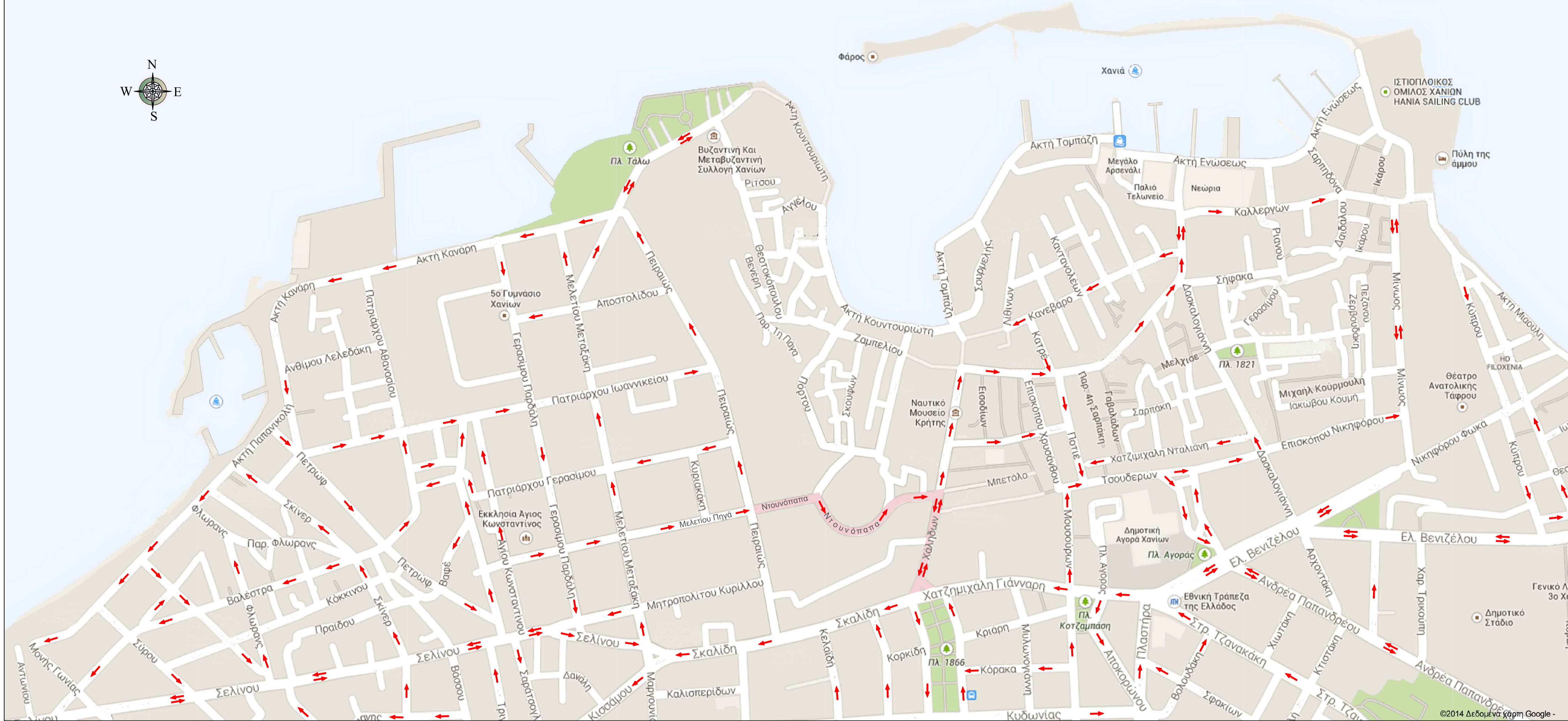
Υφιστάμενες κυκλοφοριακές ρυθμίσεις