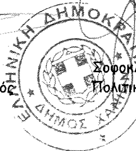
Σοφοκλής Τσιραντωνάκης Πολιτικός Μηχανικός