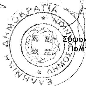
Σοφοκλής Τσιραντωνάκης Πολιτικός Μηχανικός