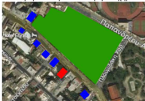
■ Διατηρητέο κτίριο Δήμου Χανίων ■ Άλλα νεοκλασσικά κτίρια ■ Δημοτικός Κήπος

Η κίνηση οχημάτων στην περιοχή είναι αυξημένη, ωστόσο αναμένεται να μειωθεί λόγω της μελέτης που έχει εκπονηθεί και προβλέπει ήπια κυκλοφορία οχημάτων και ποδηλατόδρομο.