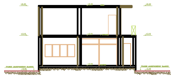
ΤΟΜΗ Α - Α