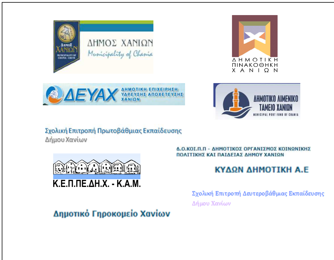
Εικόνα 2 Παρουσίαση Δημοτικών Επιχειρήσεων Δήμου Χανίων