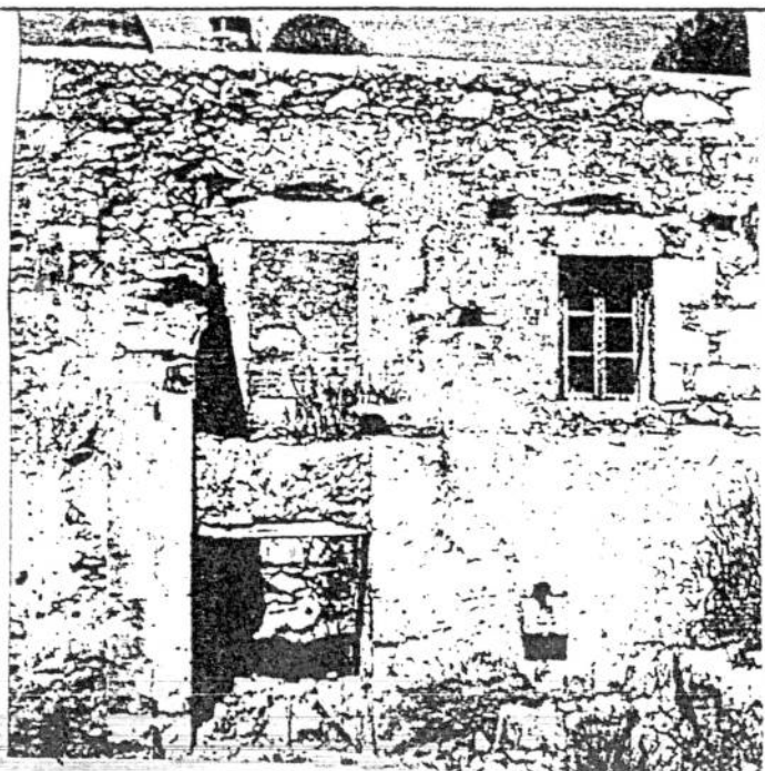
ΦΩΤ. ΚΑΤΑ ΤΗΝ ΚΡΙΣΗ ΤΟΥ ΠΡΑΞΗΤΗ