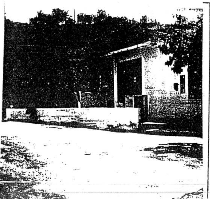
ΦΩΤ. ΚΥΡΙΑΡΧΟΥ ΤΥΠΟΥ