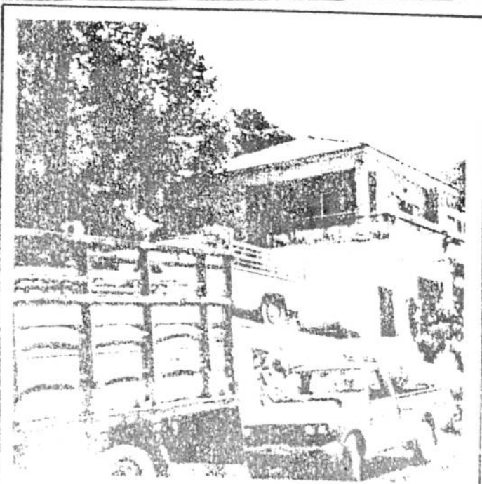
ΦΩΤ. ΚΑΤΑ ΤΗΝ ΚΡΙΣΗ ΤΟΥ ΜΕΛΕΤΗΤΗ