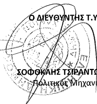
ΣΟΦΟΚΛΗΣ ΤΣΙΡΑΝΤΟΝΑΚΗΣ Πολιτικός Μηχανικός