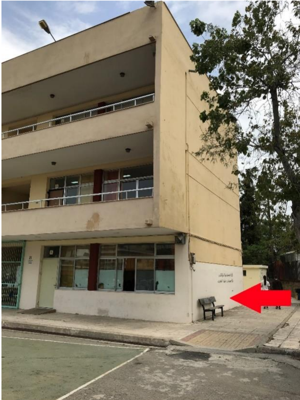
Εικόνα 6. Θέση εγκατάστασης ανελκυστήρα 2

Οι ανελκυστήρες θα πρέπει να παραδοθούν από τον κατασκευαστή σε πλήρη λειτουργία και να πληρούν όλους τους κανόνες ασφαλείας.