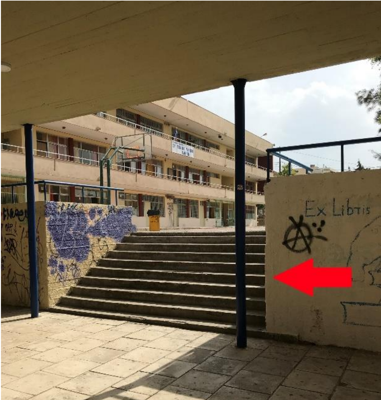
Εικόνα 7. Θέση κατασκευής του αναβατορίου