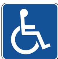
Εικόνα 2. Διεθνές Σύμβολο Πρόσβασης Αναπήρων

Η έκταση του οικοπέδου του σχολικού συγκροτήματος είναι μεγάλη και τα κτίρια είναι τοποθετημένα μακριά από το δρόμο. Σε αυτή την περίπτωση, η ασφαλής προσπέλαση ΑμεΑ / εμποδιζόμενων ατόμων εξασφαλίζεται από τον περιβάλλοντα χώρο των κτιρίων με αυτοκίνητο και στη συνέχεια με τις απαιτούμενες εξυπηρετήσεις (μέσα κάλυψης υψομετρικών διαφορών), ως τις εισόδους των κτιρίων. Η αυτόνομη μετακίνηση στον περιβάλλοντα χώρο επιτυγχάνεται από διαμορφωμένο χώρο στάθμευσης ΑμεΑ με μεγαλύτερες διαστάσεις από τις συνήθεις, περίπου 3,50Χ5,00μ, έξω από τα κτίρια. Η θέση αυτή φέρει την κατάλληλη σήμανση, καθώς και το Διεθνές Σύμβολο Πρόσβασης Αναπήρων (Εικόνα 2), τόσο επίστευλη σε εμφανές σημείο, όσο και επί του δαπέδου, σε αυτή δε την θέση απαγορεύεται η στάθμευση άλλων αυτοκινήτων.