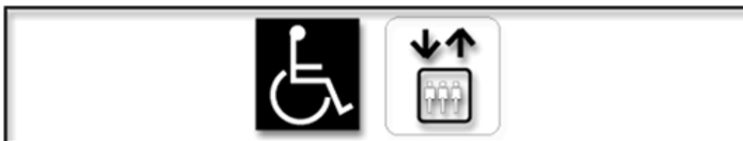
Εικόνα 4. Σήμανση Ανελκυστήρα για άτομα με ειδικές ανάγκες