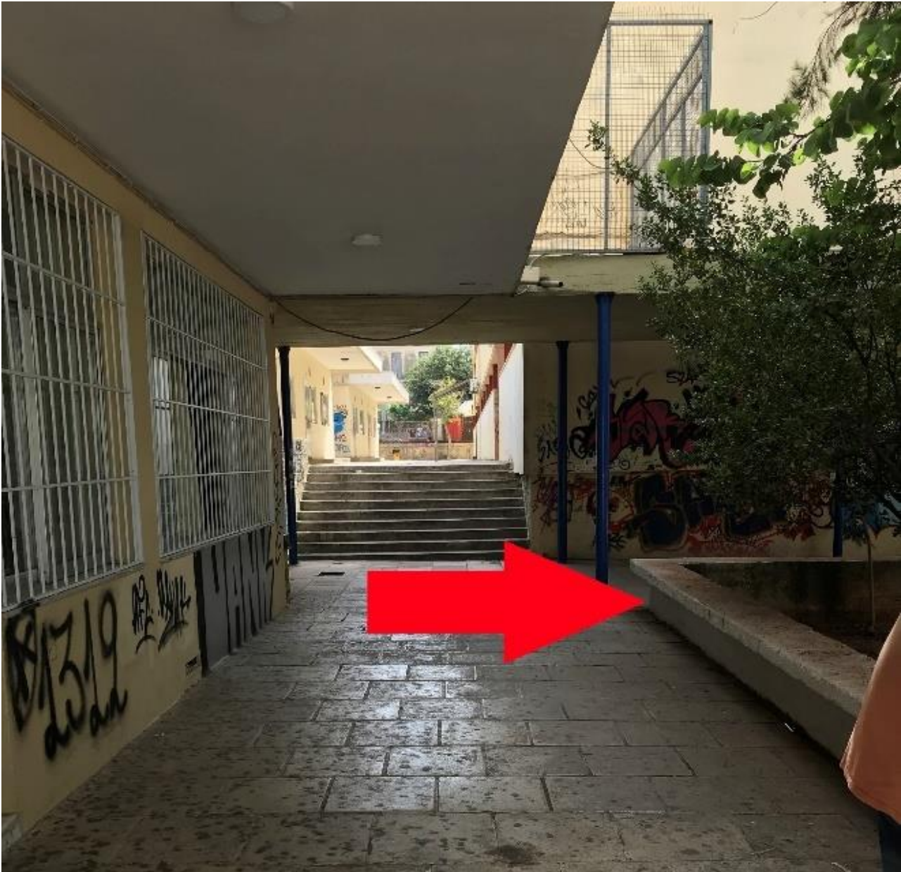
Εικόνα 5. Θέση εγκατάστασης ανελκυστήρα 1

Για τον ανελκυστήρα 2 που εξυπηρετεί τα κτίρια 4, 5 λόγω της θέσης που θα τοποθετηθεί θα κατασκευαστεί και μια μεταλλική επέκταση για την ομαλή πρόσβαση στον εξώστη του κτιρίου.