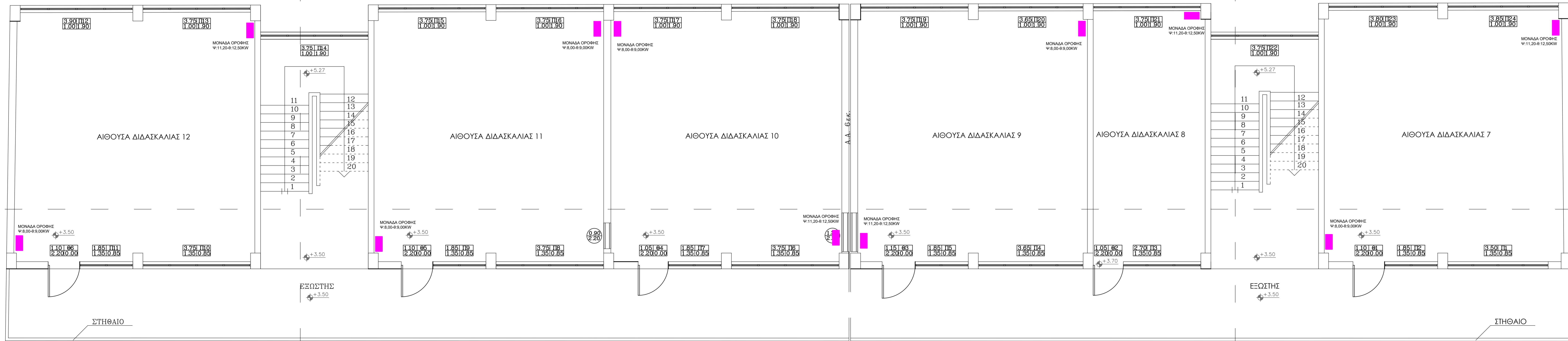
ΚΑΤΩΨΗ Α ΟΡΟΦΟΥ 3ο ΓΥΜΝΑΣΙΟ & 4ο ΓΥΜΝΑΣΙΟ ΧΑΝΙΩΝ ΚΛΙΜΑΚΑ 1:50