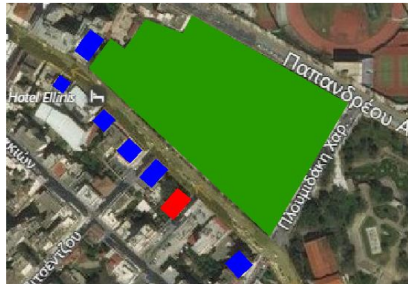
■ Διατηρητέο κτίριο Δήμου Χανίων ■ Άλλα νεοκλασσικά κτίρια ■ Δημοτικός Κήπος

Η κίνηση οχημάτων στην περιοχή είναι αυξημένη, ωστόσο αναμένεται να μειωθεί λόγω της μελέτης που έχει εκπονηθεί και προβλέπει ήπια κυκλοφορία οχημάτων και ποδηλατόδρομο.