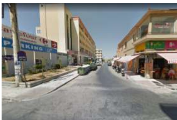
Φ13 Πειραιώς από Σκαλίδη