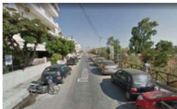
Φ14 Πειραιώς προς Βορρά