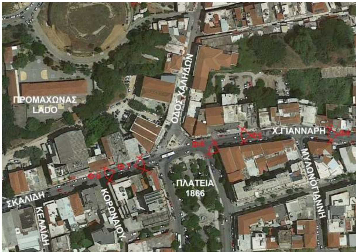
αεροφωτογραφία κόμβου πλατείας 1866