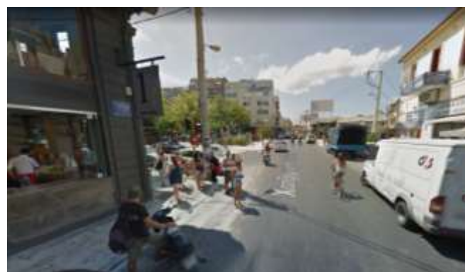
Φ5 από Χ.Γιάνναρη προς Πλατεία 1866