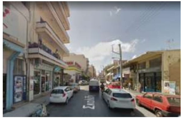
Φ8 Σκαλίδη- Κορωναίου