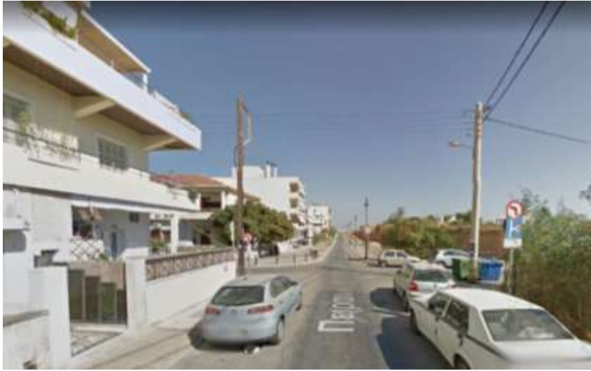
Φ15 Πειραιώς συμβολή με υφιστάμενη ανάπλαση