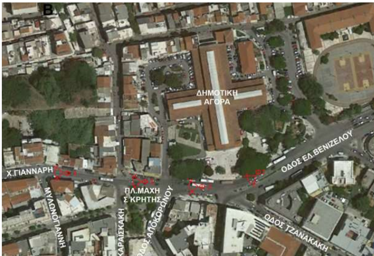
αεροφωτογραφία κόμβου Πλατείας Αγοράς