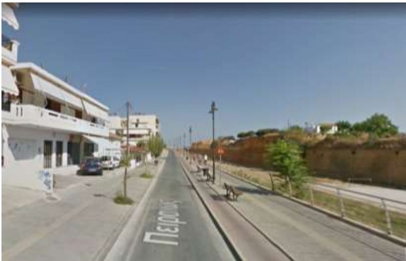
Φ16 Πειραιώς υφιστάμενη ανάπλαση