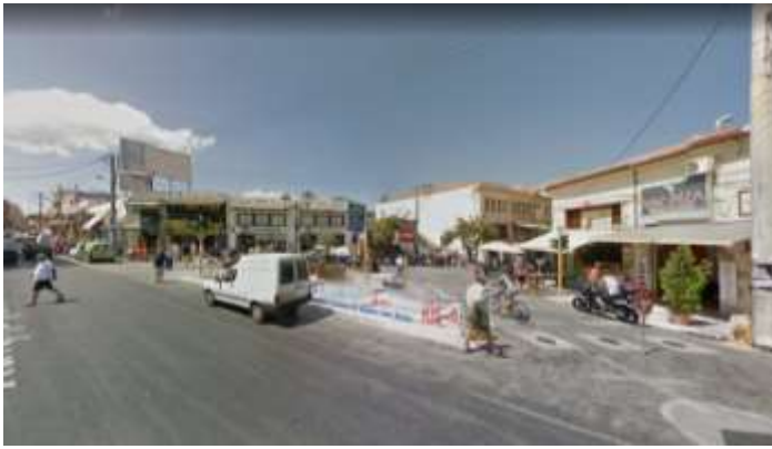
Φ7 από Σκαλίδη προς πλατεία 1866-Χάληδων