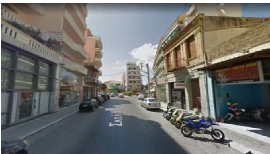
Φ12 Σκαλίδη – τέλος ανάπλασης