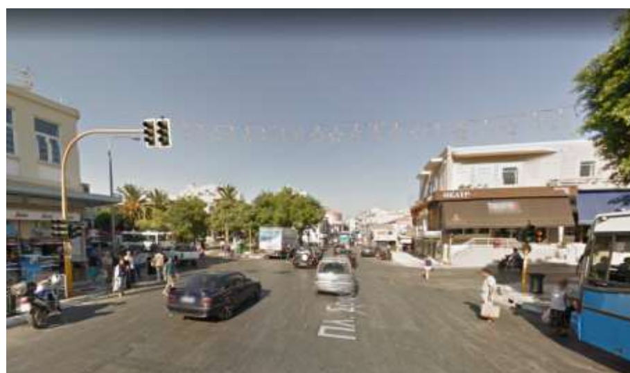
Φ2 Πλατεία Αγοράς- Αποκορώνου-Πλατεία Μάχης της Κρήτης