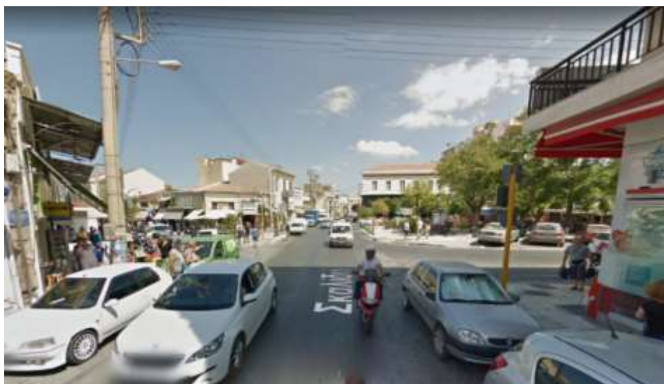
Φ6 Σκαλίδη – Χάληδων