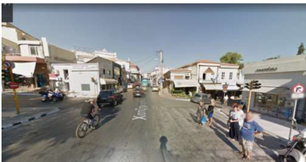
Φ3 Πλατεία Αγοράς – Καραϊσκάκη-Μουσούρων – αρχή Χ.Γιάνναρη