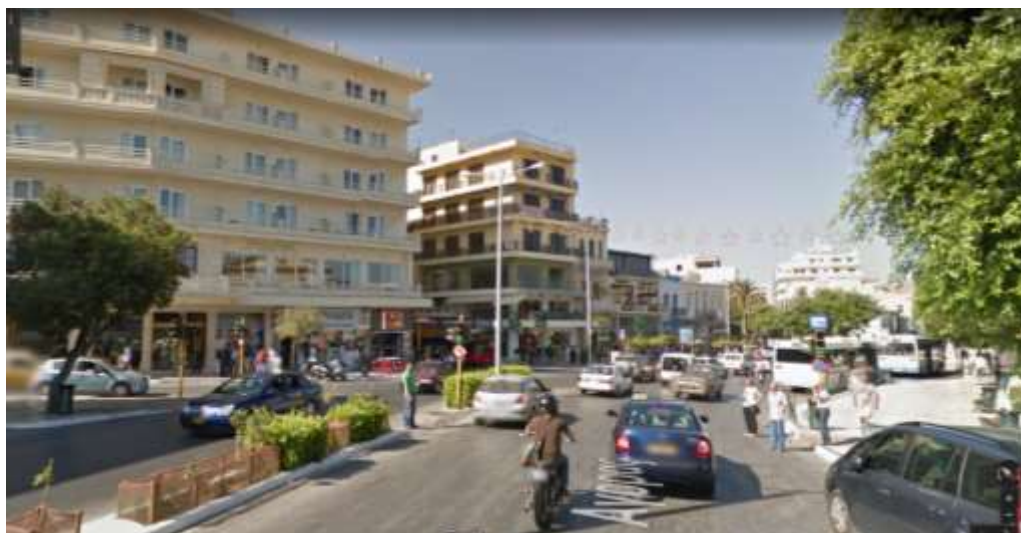
Φ1 Προς πλατεία Αγοράς από οδό Ελ.Βενιζέλου