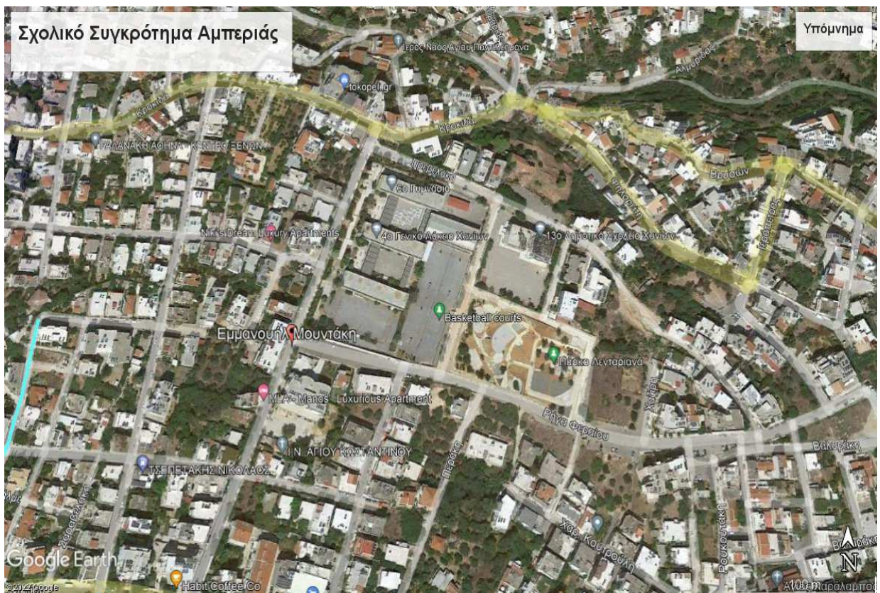
2.Αμπεριάς Πρεβελάκη- Εμ.Μουντάκη-Ρήγα Φεραίου.