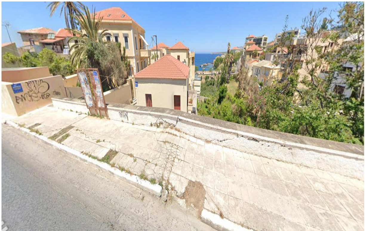
Οδός Μανούσου Κούνδουρου

Ενδεικτικό φωτογραφικό υλικό από τις οδούς που θα γίνουν οι εργασίες: