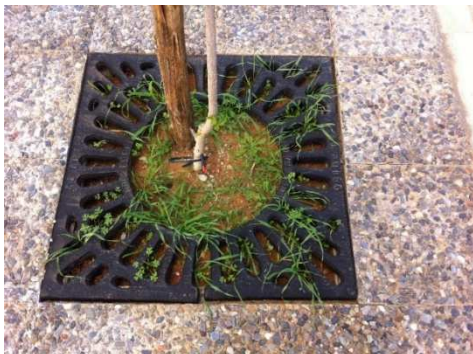
Ενδεικτική σχάρα δέντρου.

Τόσο στα νέα όσο και στα υφιστάμενα δέντρα τοποθετούνται μεταλλικές σχάρες 1,00μ x 1,00μ ή 0,70μ x 0.70μ ανάλογα με το μέγεθος της δεντροδόχου,,