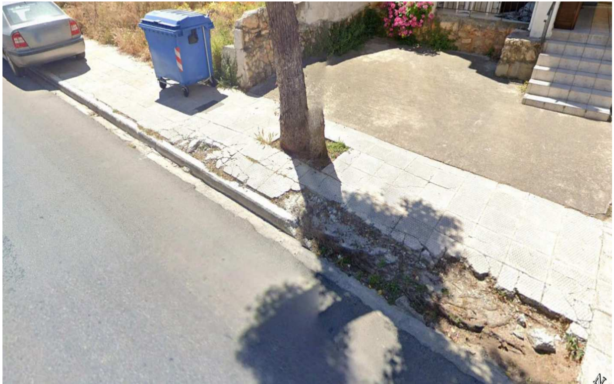
Οδός Κωνσταντίνου Μητσάκη