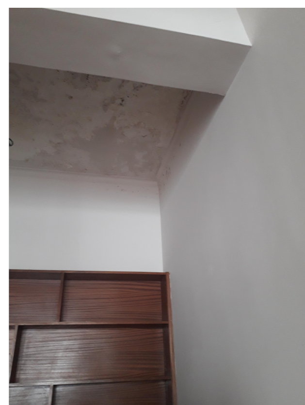
Φωτο 7 1:13.33

Ενδειξη υγρασίας στα επιχώματα από διαρροές των υδραυλικών